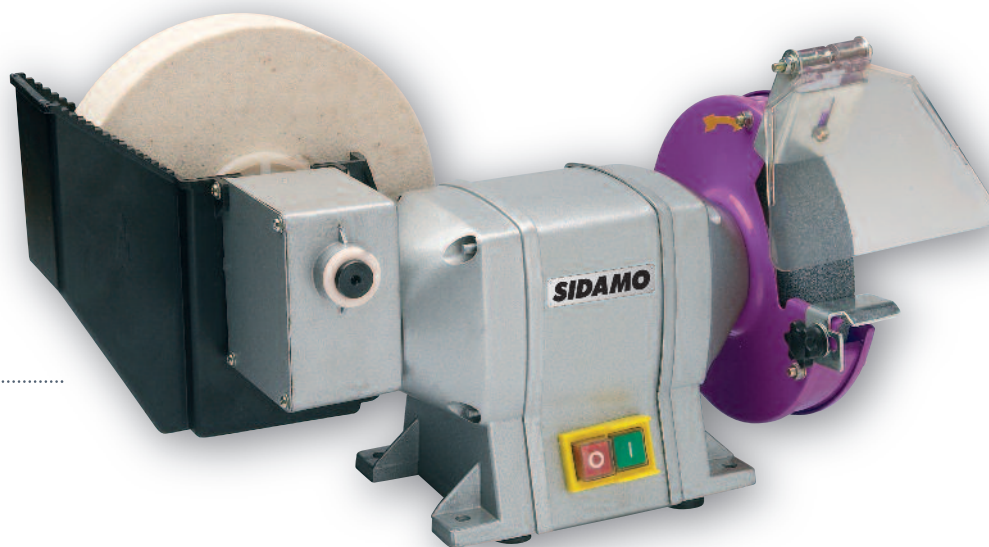
G 150 ME .....

Par mesure de sécurité, nous vous rappelons qu'il est obligatoire de fixer le touret sur un socle ou sur un établi.